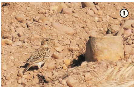
Alondra ( Alauda arvensis )

En invierno se agrupan en grandes bandos que sobrevuelan las rastrojeras en busca de semillas.