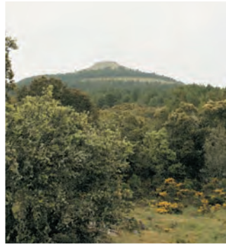
Alto del Castillejo

2 En la sierra de las Mamblas, con sus relieves plegados (ejemplo de sinclinal colgado), existe una variada población de rapaces que vive en los roquedos y cantiles con repisas, donde instalan sus nidos. El águila real es una rapaz diurna que vive este hábitat, alimentándose de reptiles, pequeños mamíferos y aves.