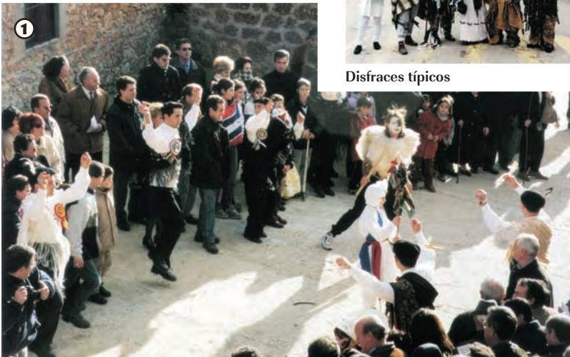
La Corrida del Gallo (domingo de Carnaval)

La Corrida del Gallo comienza después de comer, con el anuncio de la música de los gaiteros, que atraen la atención de los vecinos. Una vez colocado el gallo en la rueca y adornado con un mantón el zamarraco, acompañado de alguaciles y mozo mayor, se dirige hasta la casa del rey para entregarle el gallo. Al son de la dulzaina y el acompañamiento de los danzantes los vecinos pueden entrar a por el gallo. Si el que entra consigue hacer un recorrido y devolver el gallo al rey recibirá los aplausos del público, pero si recibe un garrotazo deberá devolver el gallo al zarramaco.