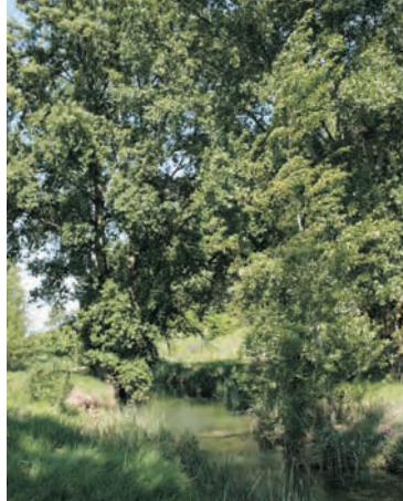
Sendero del río Ausín

1 Situada en la ribera del río Ausín se alza la torre de Olmosalbos, construida en el s.XVI por el mercader Diego Gamarra, un comerciante enriquecido con sus lavaderos de lana. La torre está construida con piedra de Hontoria, la misma que se empleó en la Catedral de Burgos.