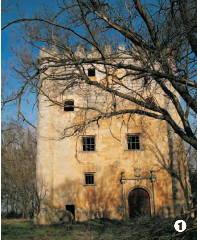
Castillo de Olmosalbos